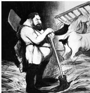
Очистка авгиевых конюшен Гераклом. Оноре Домье. 1842 год

Перейдём к примеру, более близкому к нашей основной теме.