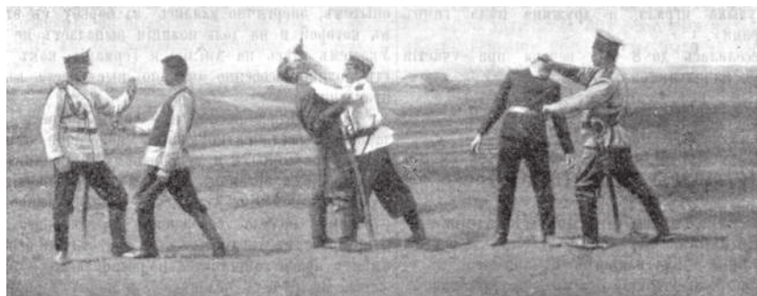
Рис. 1. Обучение стражников Саратовской губернии приёмам японской борьбы («Вестник полиции», 1908 г., № 48, с. 11, фото 1)

В 1914 году вышло второе авторское руководство для полиции «Самооборона и арест» Ивана Владимировича Лебедева. Описание приёмов и их исполнение на фотографиях также сделаны Лебедевым специально для этого издания. Большое количество фотографий, отражающих пошаговое исполнение приёмов, являются безусловным плюсом данного издания. М.Н. Лукашев считал, что И.В. Лебедев специально разрабатывал курс приёмов для полиции на основании его опыта в классической борьбе с включением не-