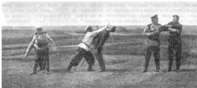
Рис. 2. Обучение стражников Саратовской губернии приёмам японской борьбы («Вестник полиции», 1908 г., № 48, с. 11, фото 2)