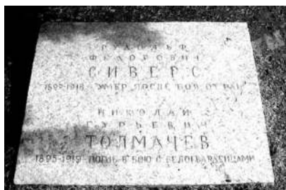
Памятная доска на Марсовом поле

Пам'ятна дошка на Марсовому полі Умови військової служби, жити одному в порожній квартирі було незручно, і він переїхав до товаришів по навчанню. Вони утворили своєрідну комуну. Навчальне навантаження було дуже високим – 8 годин лекцій кожен день, ніяких канікул, велика самостійна робота. Звичайно, такі труднощі було легше подолати з друзями. Він розповідав, що чотири ромби в петлицях (приблизно відповідає званню віце-адмірала) були тільки у нього і начальника академії Л.Д. Покровського. Смиренність і навіть аскетизм завжди були однією з головних рис характеру дядька, тому носити знаки відмінності він не став.