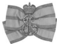
Наградной знак (шифр) для институток

Для меня всегда было вопросом, почему руководители, выдвинутые революцией из