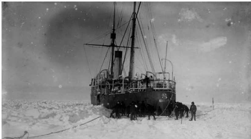
Ледокольный пароход «Таймыр»

Перспектива крупнотоннажного судоходства потребовала немедленного продолжения исследований Белого моря, в особенности пролива, соединяющего его с Баренцевым морем. Поэтому практически сразу после выхода в море «Экспедиции Ледовитого океана» была организована Гидрографическая экспедиция Белого моря. И деда, успешно справившегося с организацией первой