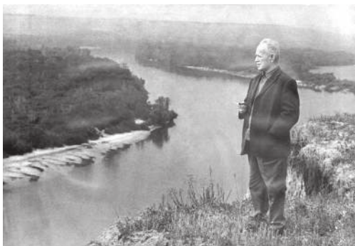
М.А. Шолохов на Дону