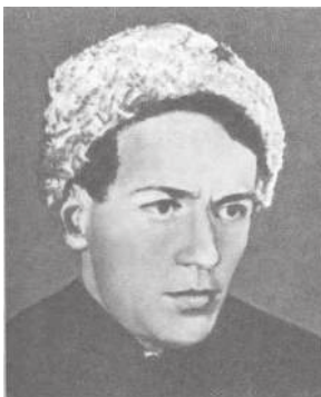
М.А. Шолохов. Фото 20-х годов

А бесконечный гений, невесть откуда, с какого неба свалившихся и появившихся перед народом в городе Ливерпуле в строгих костюмах и с глупыми причёсками семнадцатилетних парнишек, создавших сотни потрясающих текстов и мелодий, которые во все века будут теперь петь и повторять все континенты. И имя их ансамбля тоже было глупое – «Битлз», то есть «Жуки». Ну и жужжали бы себе, жуки, но четверо ребят с гитарами прокричали на весь белый свет, что они гениальны, и люди, послушав их, с этим согласились. И я согласился тоже.