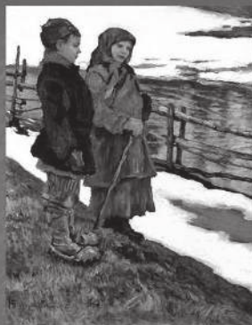
Крестьянские дети. Худ. Н. П. Богданов-Бельский