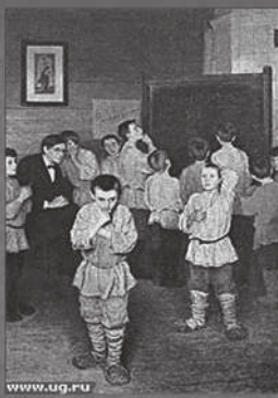
«Устный счет». Худ. Н.П.Богданов-Бельский