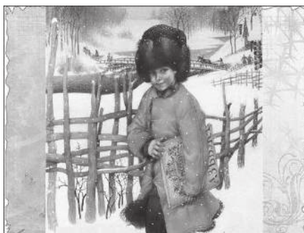
Иллюстрации Г. Спирина