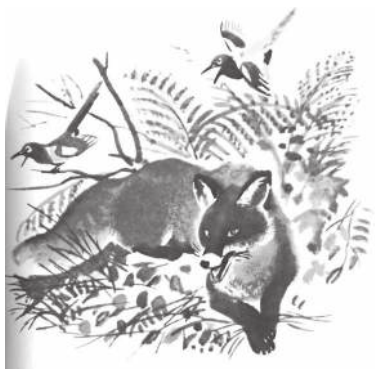
Васильева. Хитрый лис

– Ой, да я ж не знала, что они меня там задержат. Не успела тебе сказать, что надо лопатой по ведру бить, он только этого и бо-