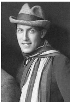
Анатолий Мариенгоф (1897-1962)

Открыты сцены, зритель не весел. Длинный по всей ширине чёрный стол, зритель по всей высоте — пустой книжный стеллаж, только в одной ячейке стоит пара книг, одна ячейка освещена, — это окно в комнату главной героини инсценировки — Ольга, шубу надевает только при появлении зрителя, влюблённый не Владимир. Сценография весьма лаконична.