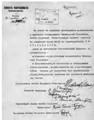
Постановление о независимости Финляндии

Чтобы было понятно современникам, поясним: кронштадтские моряки в 1917 году стали опорой партии Ленина (большевиков) и даже приняли активнейшее участие к переходу власти. Но за 3 года, с 1917 по 1920 гг., положение военных моряков Кронштадтской военно-морской крепости, в условиях послевоенной разрухи и проблем с продовольствием, значительно ухудшилось. Вооружённые «до зубов» военные моряки, преимущественно матросы, стали требовать передачи власти от партии большевиков — Советам рабочих, крестьянских и военных депутатов. Правящая партия большевиков с этими требованиями, естественно, не соглашалась. Мятежники арестовали комиссара Кронштадтского