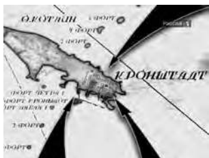
Схема подавления Кронштадтского мятежа

Первая атака частей Красной Армии против мятежников была предпринята с 7 на 8 марта 1921 г. Наступление велось со стороны Сестрорецка отрядом курсантов военных школ и со стороны Ораниенбаума полком особого назначения. Батальон этого полка уже ворвался в Кронштадт, но, не получив поддержки, понеся большие потери, вынужден был отступить. Атака провалилась, потому что солдаты не хотели идти на штурм матросской крепости. В результате боя в морской госпиталь поступила первая партия раненых мятежников в количестве 40 человек.