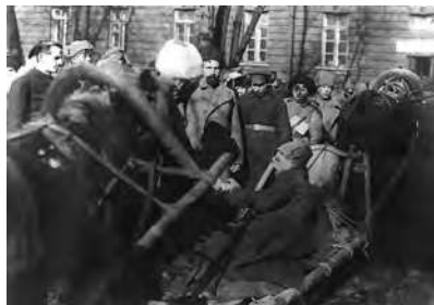
Транспортировка раненого в госпиталь