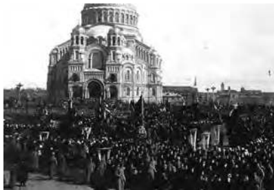
Кронштадт. Митинг на Якорной площади

В конце апреля 1917 г. в Кронштадте был организован «Союз фельдшеров и акушерок», членами которого стал весь средний