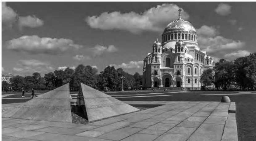
Кронштадт. Якорная площадь. Памятник жертвам мятежа