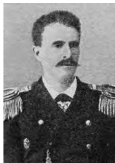
Вирен Роберт Николаевич (1856–1917)