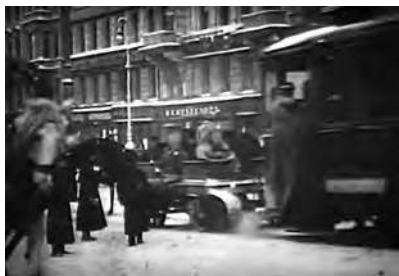
Революционный трамвай. Петроград, 1917 г.

Взятие телефонной станции с дежурившими там «телефонными барышнями» выглядело более ярко. Чтобы испугать охрану и принудить её сдать без боя, было решено подвезти к зданию станции пушку. В качестве тягловой силы использовали трамвай. Этой своей идеей дед очень гордился. В Интернете нашлась фотография «революционного трамвая». При виде пушки охрана станции разбежалась.