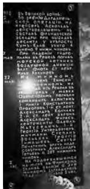
Памятная доска в Никольском Морском Соборе г. Кронштадта