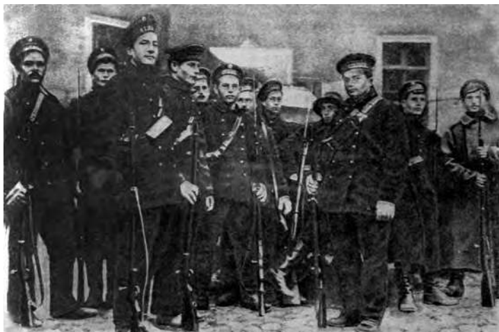
Сводный морской отряд под руководством П. Дыбенко, прибывший в Гатчину.

1 ноября в Гатчину приехали народный комиссар по военным делам В.А. Антонов-Овсеенко и назначенный комиссаром Гатчины С.Г. Рощаль. Они сохранили хрупкое равновесие сил в городе, предлагая различные решения для выхода из сложившейся ситуации. Вызванные Керенским с фронта воинские части в Гатчину так и не дошли. И, как свидетельствовал Краснов, «...было ясно, что перемирие полетело к чёрту, и всё погибло. Мы в плену