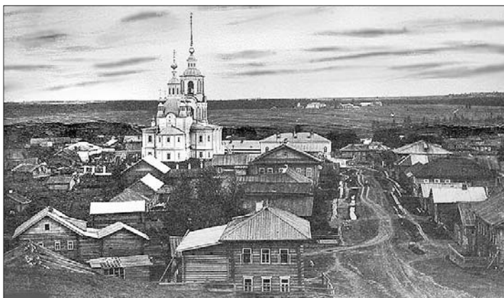
Вохма. Историческое фото.