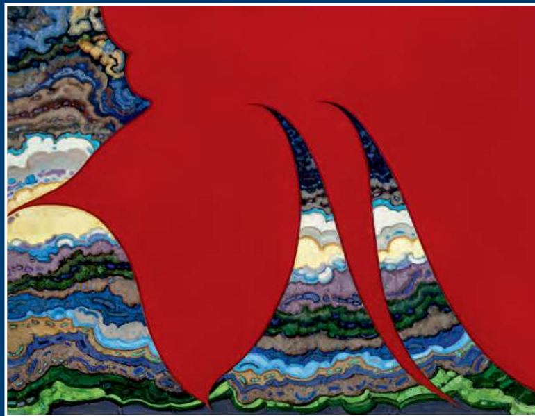
А. В. Суслов. Восточный пейзаж. 2019. Холст, масло. 150x195