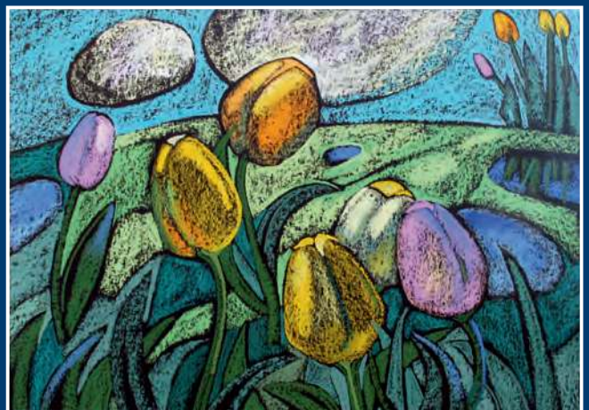
Е. П. Гаврилова. Тюльпаны. Триптих. Лист 2 2008. Тон. бум., пастель. 50x70