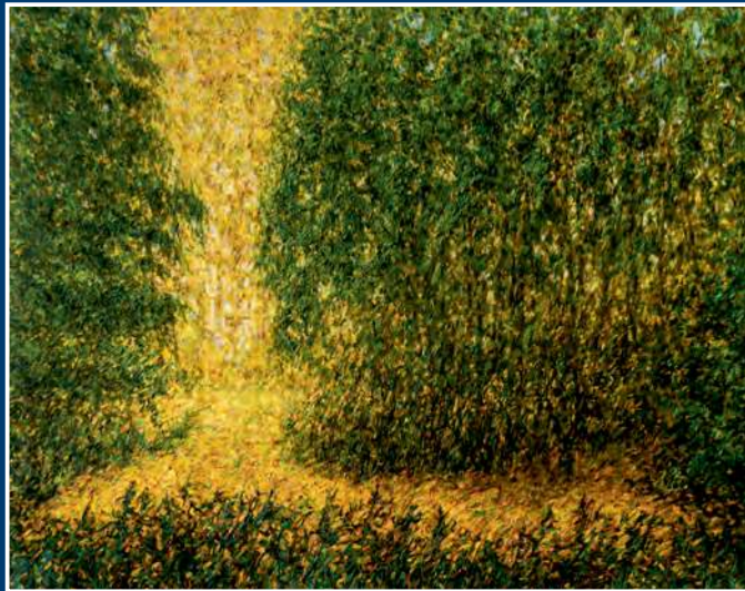
А. Г. Храбрый. Свет с небес. 2016 Холст, масло. 160x200