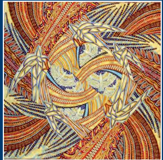
Н. А. Спесивцева. Над городом праздник 2015. Бум., цв. тушь, перо. 60x60