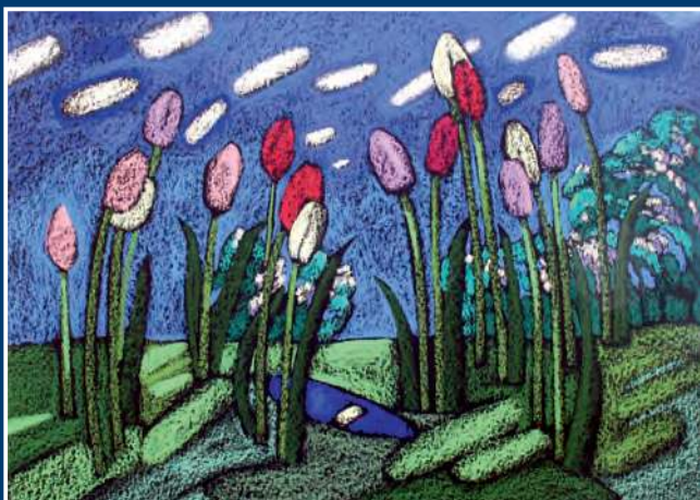
Е. П. Гаврилова. Тюльпаны. Триптих. Лист 1 2008. Тон. бум., пастель. 50x70