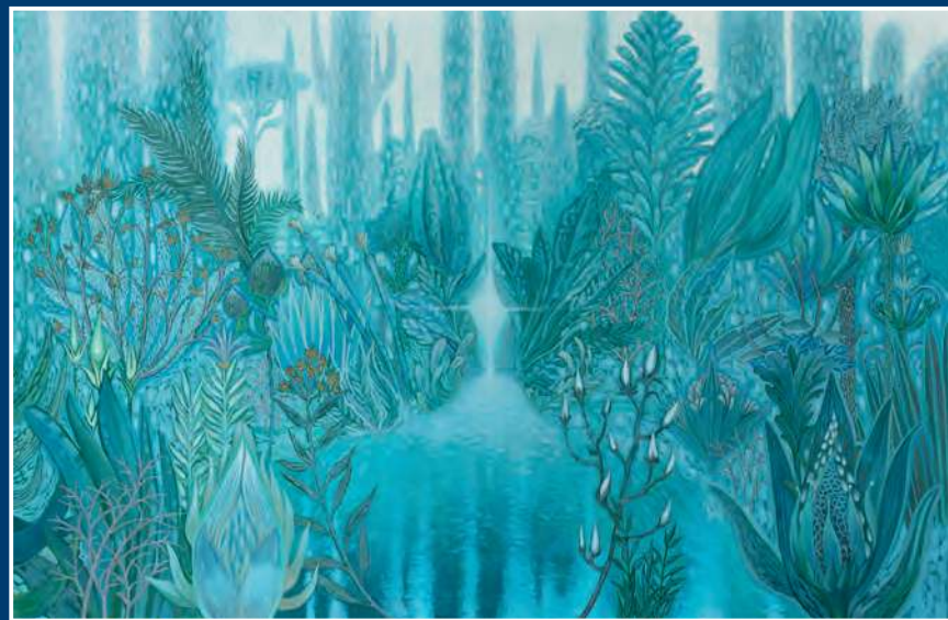
Я. А. Хмель. Родник. 2019. Холст, масло. 110x160