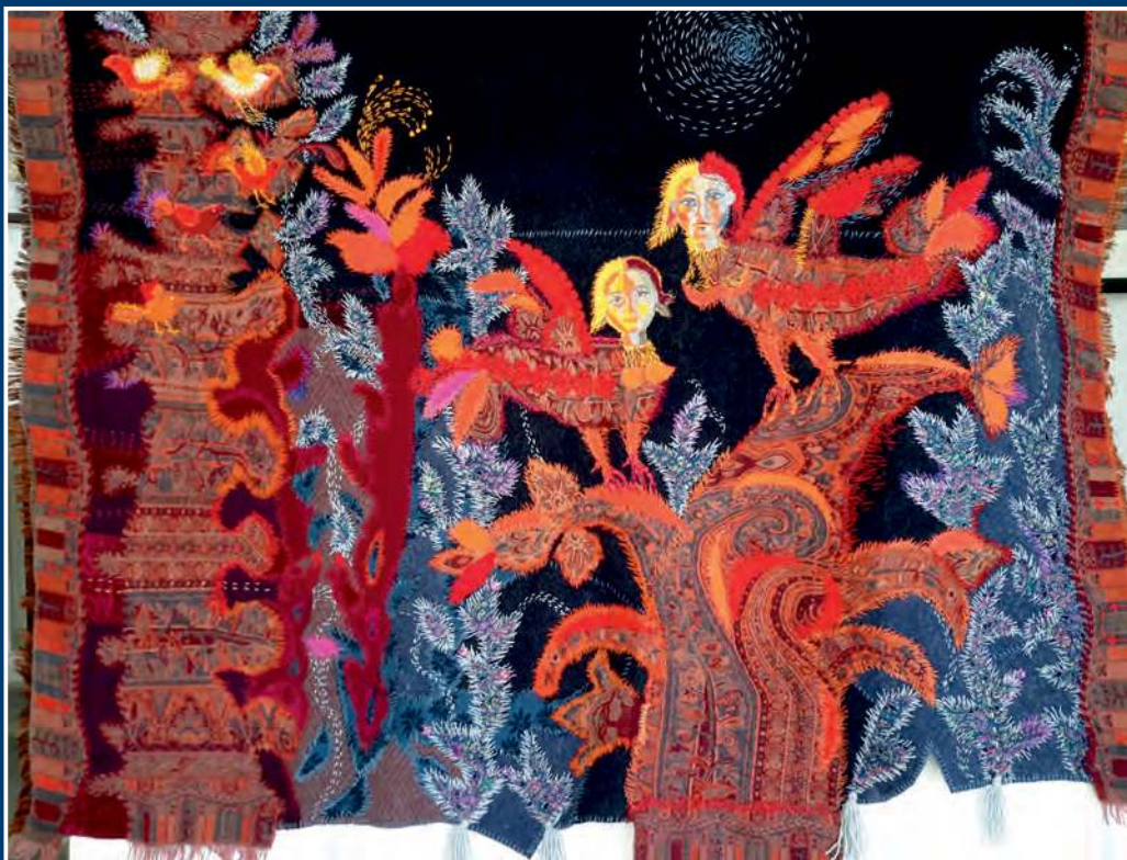
А. Г. Архиповская. Разговор о счастье. Мать и дочь. 2018 Тех. аппликация, вышивка. 120x90