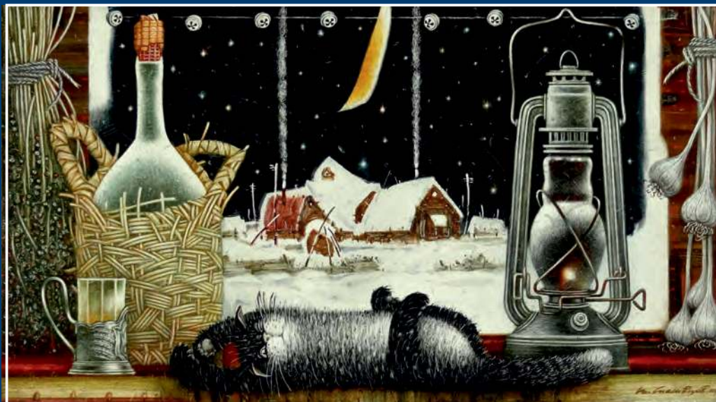
В. Ю. Спесивцев. Святки в бане. 2015. Картон, масло. 48x87