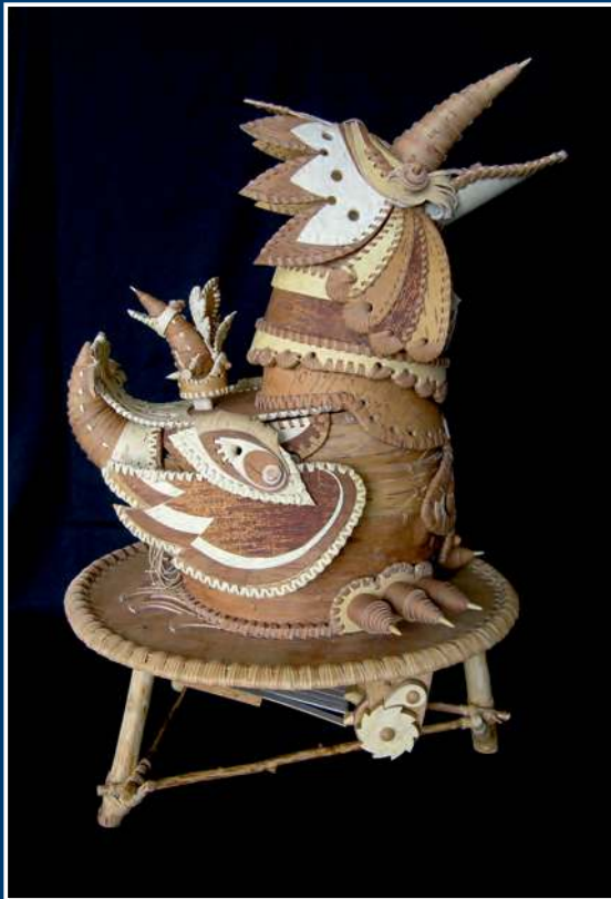
Р. Х. Багаутдинов. Чижик-пыжик Музыкальный трансформер 2018. Береста, дерево. 70x50x50