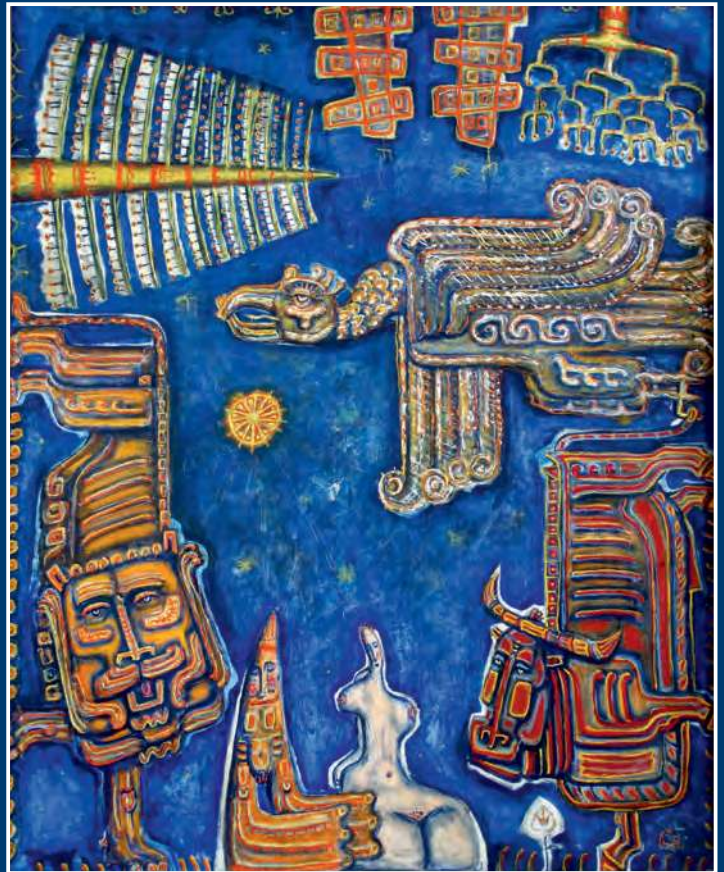
С. В. Соломатин. Над небом голубым. 2001