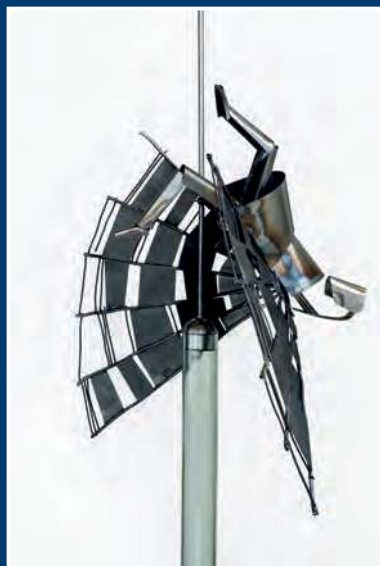
В. А. Ерофеев. Обитель. 2017