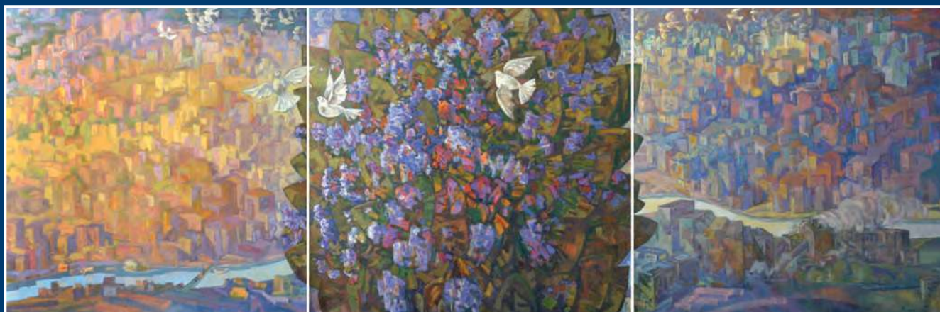
П. П. Решиков. Кузнецкое время. Триптих. 1996–2013. Холст, масло. 125x375