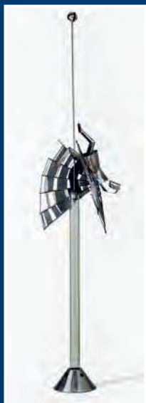
В. А. Ерофеев. Ожог. 2017