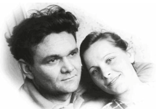
Осень 1949 года