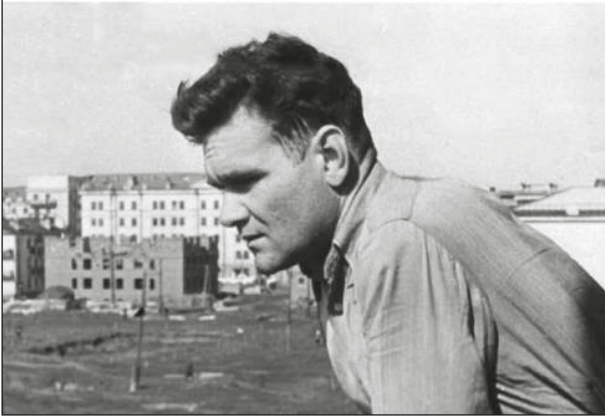
Сталинск. 1946 год