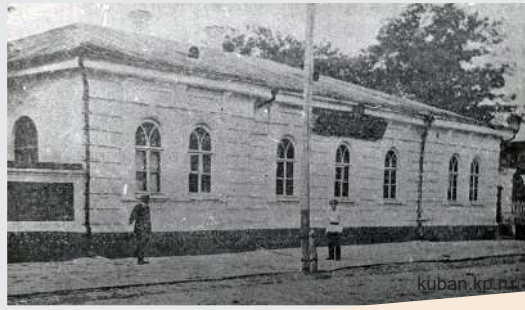
Здание Кубанского войскового музея по ул. Рашилев- ской, 3. Начало XX века.