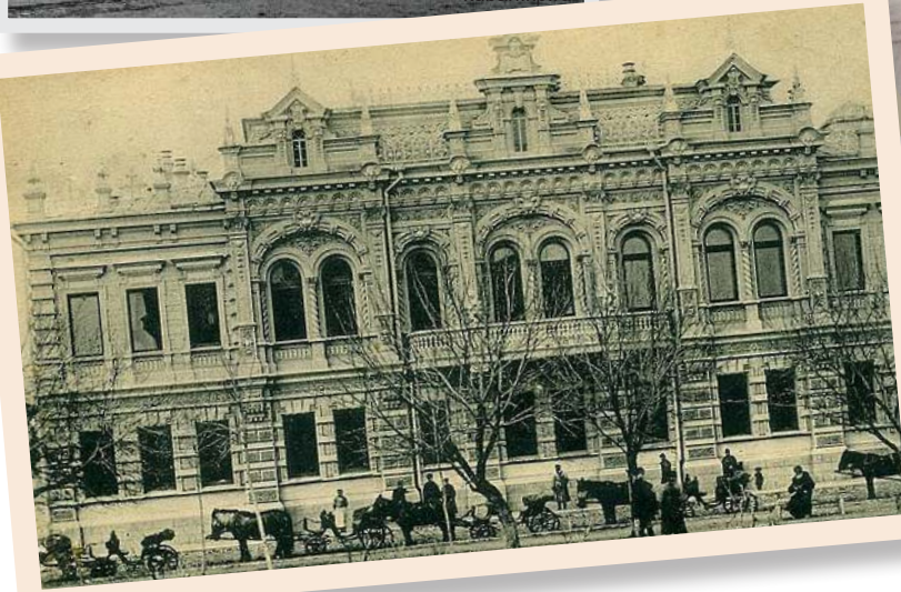
Дом, в котором сейчас располагается городской археологический музей, был построен местными купца- ми, братьями Богарсуковыми.

В 2019 году исполняется 140 лет со времени создания Кубанского войскового этнографического и естественноисторического музея, правопреемником которого является Краснодарский государственный историко-археологический музей-заповедник им. Е.Д. Фелицына.