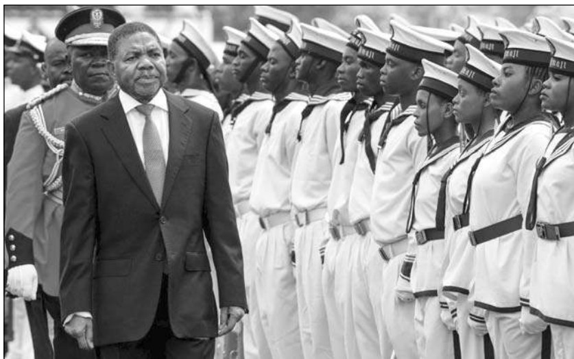
Президент Занзибара Али Мохамед Шейн