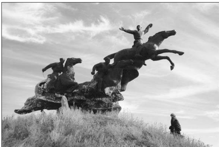
Памятник комкору Б.М. Думенко

Но особо гордится мастер, что его творчество востребовано и на малой родине — в Богучаре. В городском парке