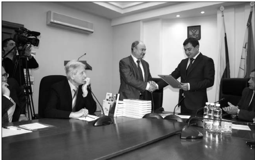
Презентация «Подъёма» в Воронежской областной Думе. 2017 г.

ности, Константин Симонов, Сергей Михалков, Владимир Карпов, Юрий Бондарев, Валентин Пикуль, Василий Белов и др.