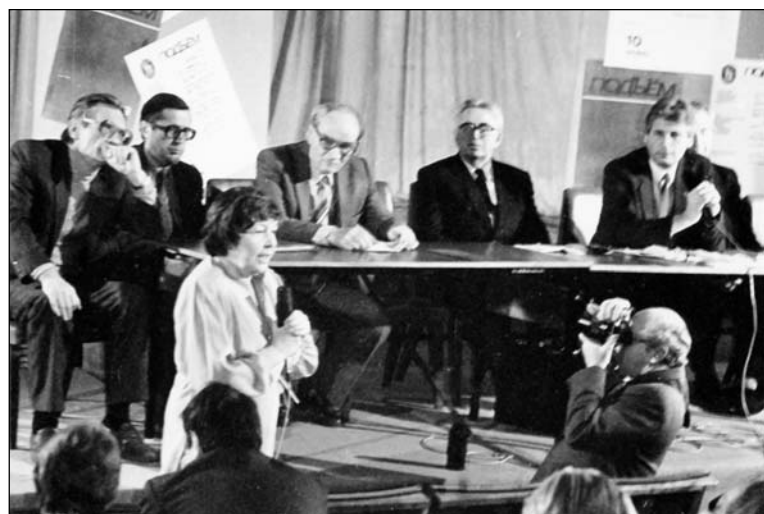
Вечер «Подъёма» в Государственной библиотеке им. В.И. Ленина в Москве. 1989 г.

Через шесть лет, а именно в 1937 году, на базе журнала создали альманах «Литературный Воронеж». Возобновился выпуск «Подъёма» под своим историческим названием лишь в 1957 году. Тогда он обрел статус всесоюзного издания. В нем, наряду с местными авторами, печатались известные советские писатели, в част-