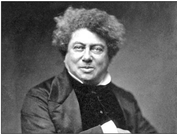
Александр Дюма (отец)