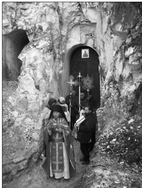
Крестный ход у входа в пещерный храм Александра Невского, 2006 г.

Отметим, что среди многочисленных культовых пещер Воронежского края, созданных в рамках народного пещерокопания, только Белогорские пещеры смогли трансформироваться к