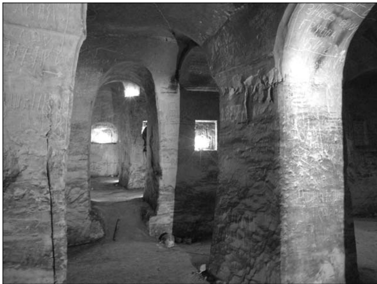
Храм в пещере у с. Гороховка.