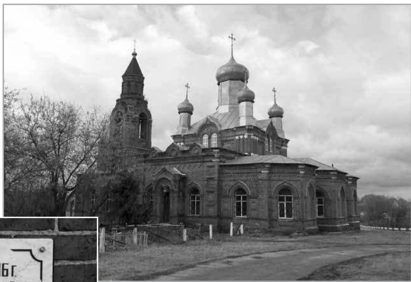
Введенская церковь с. Подлесная Слобода