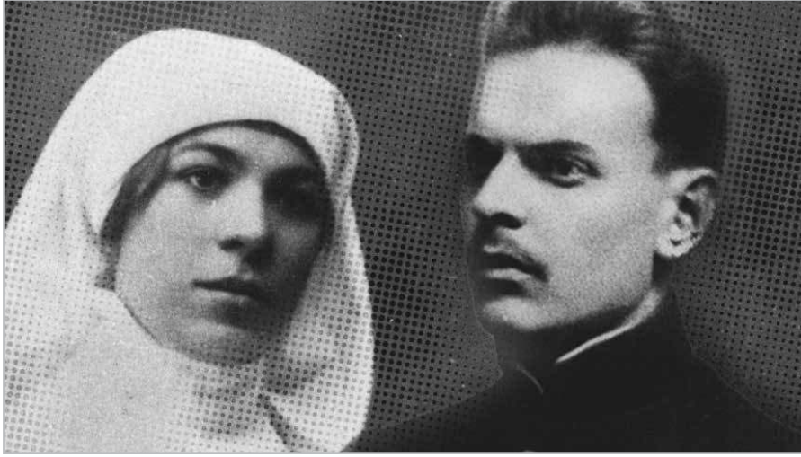
Е. Загорская и К. Паустовский в молодые годы (фотоколлаж)