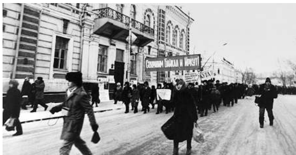
Колонна протестующих демонстрантов вступает на улицу Карла Маркса — центральную улицу города

Тем временем демонстранты свернули на улицу Карла Маркса. У меня ещё оставалось время перекрыть дополнительными силами и техникой улицы Сухэ-Батора и Ленина, по которым шествующие могли бы вдруг направиться к обкому партии, что я и сделал (шествие к зданию обкома партии даже изначально не планировалось, а весь свой путь демонстранты организованно прошли строго по намеченному накануне маршруту. — Ред. ).