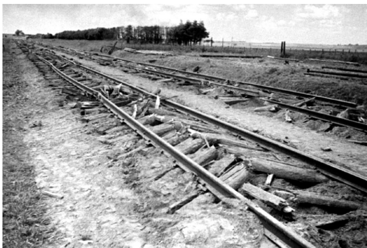
Железнодорожные пути, разрушенные фашистами.

му предложению Военный совет фронта провел ряд мероприятий с тем, чтобы не дать противнику разрушить железные дороги или, во всяком случае, значительно уменьшить масштабы повреждений. С этой целью 1-й воздушной армии и партизанам поставили задачу: помешать массовому разрушению железнодорожных объектов, не допустить использования противником путеразрушителей.