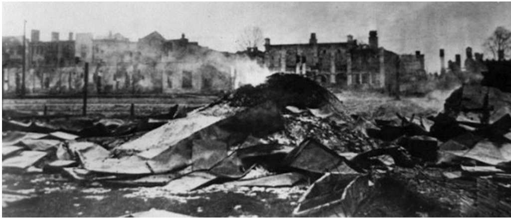
Привокзальная площадь г. Гомель

ление Фронтowej Белорусской железной дороги, которое находилось на станции Барановичи. А ВЭО № 31 продолжил восстановление железнодорожного полотна, железнодорожного хозяйства на станциях Слуцк, Могилёв, Унеча. Трудились на Украине.