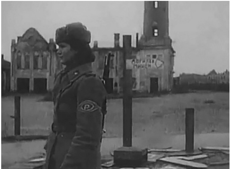
Гомель. Площадь им. Ленина. Пожарная каланча.

вогой прислушиваясь к далёкому грому артиллерийской канонады. Но страшнее всего были ночные бомбёжки. Бомбили немцы ожесточенно. Наряду с фугасными сбрасывали бомбы замедленного действия, мины-сюрпризы. Сколько людей подорвалось на куклах, на портсигарах, на вроде безобидной с виду мелочи. Прежде чем приступить к