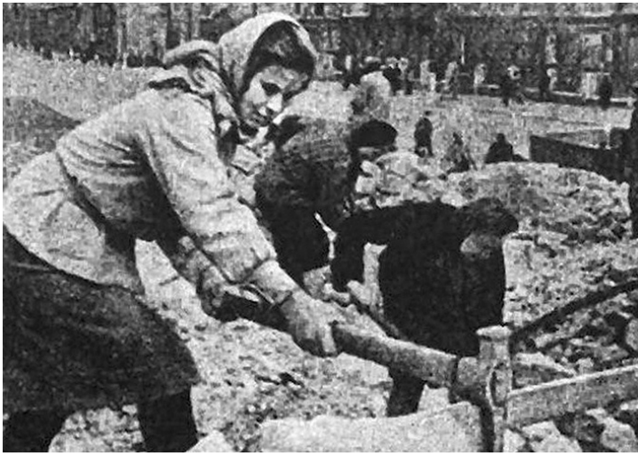
Женщины на восстановлении железнодорожной станции Гомель.

восстановлению поврежденных, порой сутками ждали окончания работы сапёров.