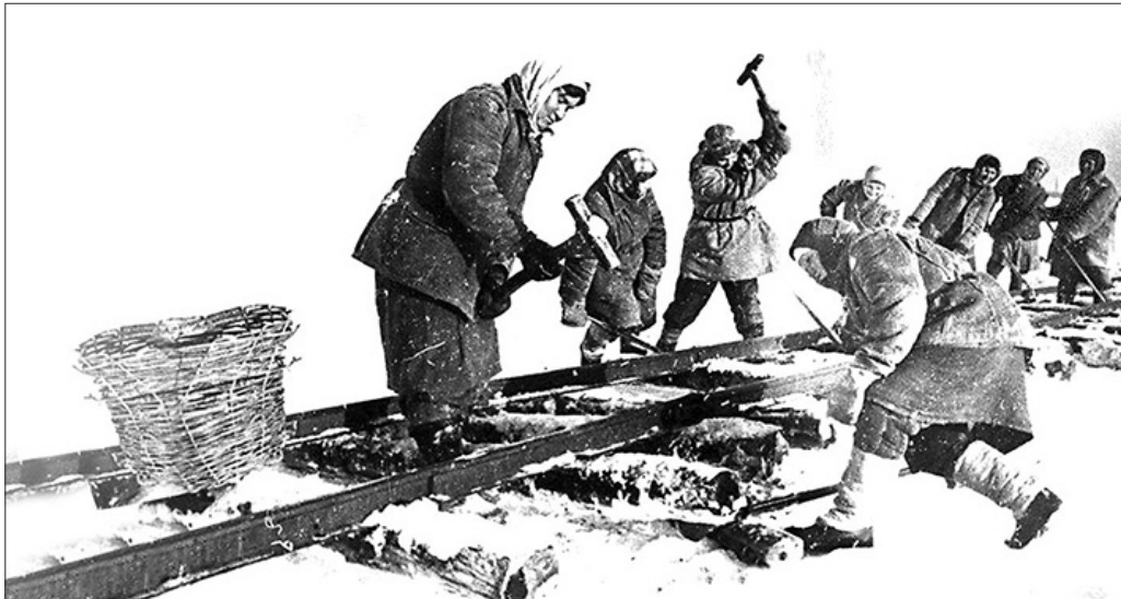
Труд женщин железнодорожниц во время Великой Отечественной войны.

Итоги работы ВЭО-31 будут подведены в приказе № 697 от 29.12.1944 г. начальником фронтовой Белорусской железной дороги Н.И. Краснобаевым: