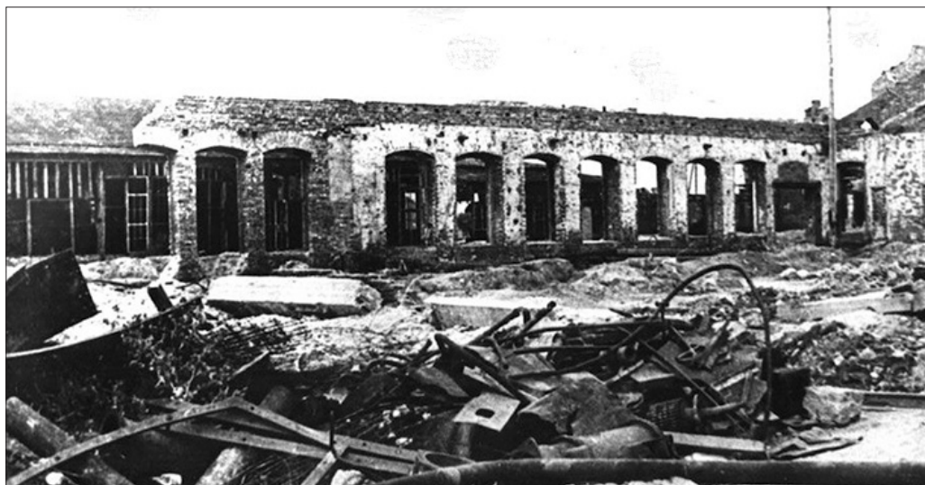
Гомельский вагоно-ремонтный завод. Работает в настоящее время, ремонт вагонов для БелЖД и РЖД.

Их встретил черный обгоревший остов вокзала, исковерканные, покорёженные развалины города, над которыми невдалеке от вокзала возвышался каркас дома Коммуны, в нём до освобождения располагалось фашистское гестапо.