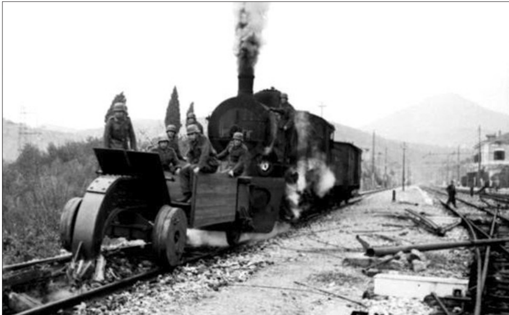
Путеразрушитель типа «крюк»

Бывший начальник военных сообщений 3-го Белорусского фронта генерал-лейтенант А.В. Добряков рассказывает: