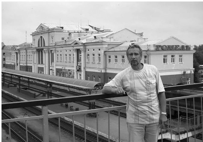
Современный вокзал г. Гомеля. Георгий Баль.

Вскоре сыграли свадьбу. Скромную, но зато на всю жизнь. Главное ценить, любить и беречь друг друга. Так и прошли по жизни бок о бок, деля радости и заботы.