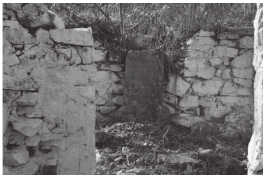
Развалины старого монастыря.

И жил я здесь, у Варлаамовских стен и колодцев, девять дней. Нашел какую-то дверь, сделал из неё нары, а матрас по пути купил. Стёкла у же