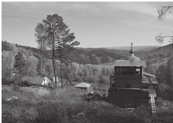
Монастырь, общий вид.

Батюшка вёл свою «Ниву», как будто на ралли, — уверенно, быстро, но не шумно. Как только с основной сельской дороги свернули в поля, мы даже улыбаться перестали: полевая дорога изобиловала промоинами, овражками от потоков дождевой воды. Оказалось, это был практически асфальт, по сравнению с тем, что мы увидели дальше. Дорога пошла в гору, в хребет. Батюшкина «Нива» лавировала среди камней, глубоких колеиных провалов, откровенных болотных трясин и оврагов. Всё это и называлось «дорога к монастырю». «Как вы тут ездите?» — поражаюсь я. «С Божьей помощью», — как о само собой разумеющемся отвечает мне священник.