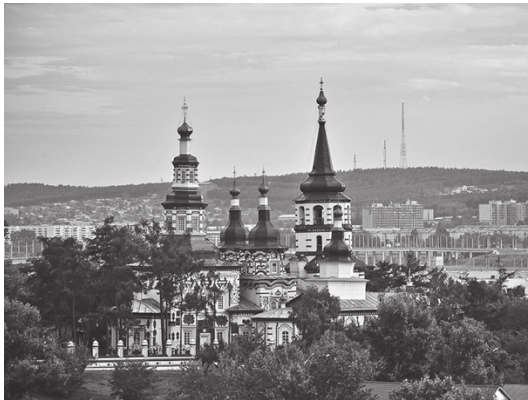
Крестовоздвиженский храм. Иркутск.

колами. В толпе зрителей раздался вздох облегчения. Посетители поспешили на представление. Циркачи, размахивая руками, скрылись в служебном помещении.