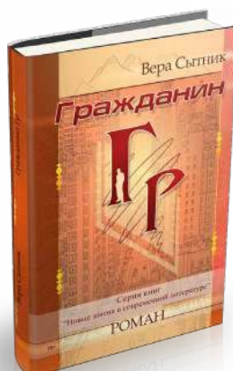
Лучший прозаик 2015 – Вера Сытник «Гражданин Гр»