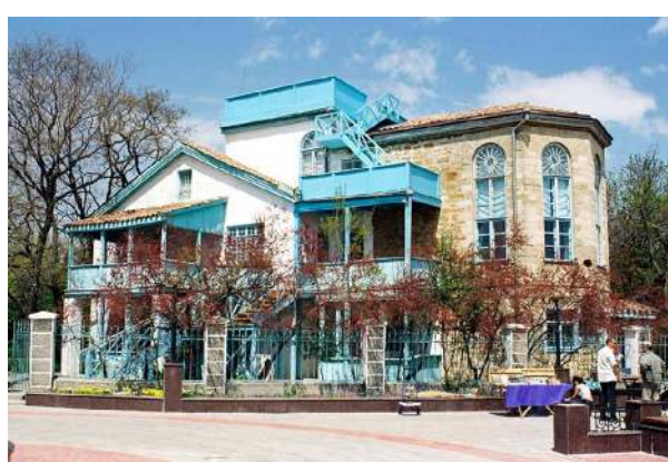
Дом в Коктебеле