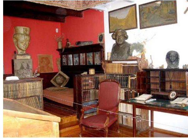
Каюта Таиах в мастерской Волошина

название – «Бегущая по волнам» – помогло А. Грину озаглавить один из известных своих романов. Привлекает внимание раковина с необычной цветовой гаммой. Бытует мнение, что М. Врубель позаимствовал краски для своей знаменитой картины.