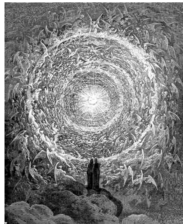
«Эмпирей. Райская роза», Поль Гюстав Доре