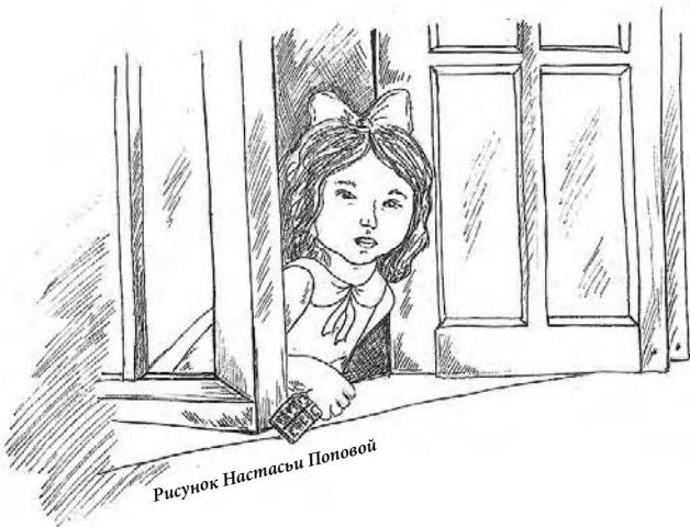
Рисунок Настасьи Поповой

— Ком, ком, — говорит один из них, подзывая кистью руки кого-то из стоящих у крыльца.