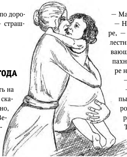
Рисунок Настасьи Поповой