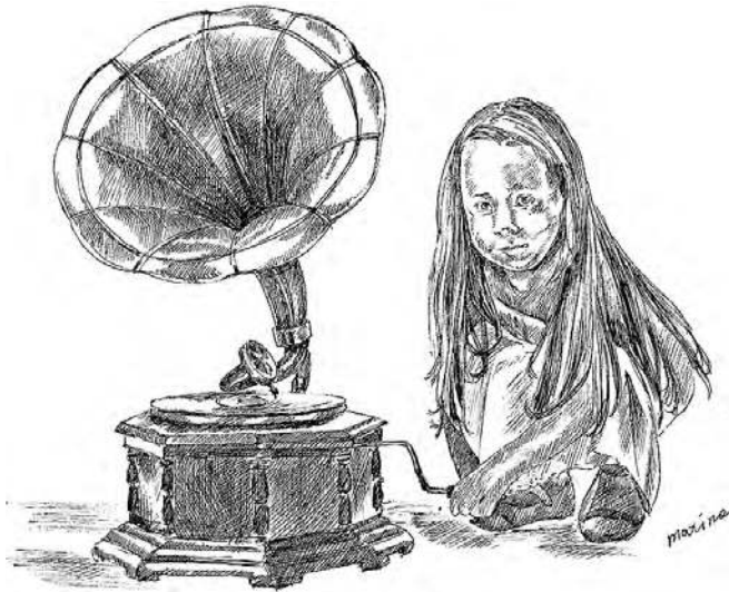
Рисунок Марины Медведевой

— Галя, иди... — подтолкнула в сторону немцев свою четырехлетнюю внучку бабушка Гали.