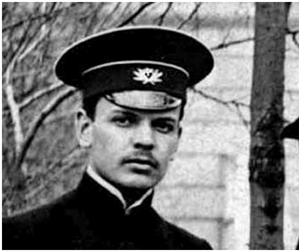
Константин Паустовский в годы учебы в гимназии

будешь расти вместе с ней. Взрослеть вместе с ней. Стареть и мудреть вместе с ней. И если ты никогда ее не покинешь, никогда не предаешь ее, наверное, ты станешь счастливой. Даже если ты совсем несчастна. Эта страна откроет тебе секрет счастья.