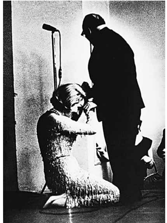
Марлен Дитрих и Константин Паустовский

Впереди меня ждал вечер с великолепной Марлен Дитрих. Вот это уровень! И другая, совсем другая жизнь. Яркая, блестящая, неожиданная и праздничная! Я сидела в зале, затаив дыхание, когда она пела. Почему вдруг резко остановился ее хриловатый голос? И ее слова, как бриллианты, на ее шее. И ее слова, как сотни камней на ее узком белом платье. Ее желание — увидеть Паустовского. И он вышел — худой, больной старик. И она, эта бриллиантовая кинодива, молча упала перед ним на колени и поцеловала руку. Эта железная западная леди, живущая за железным занавесом, плакала. И бриллианты скатились с ее платья. И рассыпались по всей сцене, по всему залу. Как тысячи, миллионы слов, драгоценных слов, так и не сказанных нами Паустовскому. Весь мир был брошен к ногам Паустовского. Весь глупый, однозначный, холодный мир. В котором не было места для сентиментальности и романтики. Вот если бы хотя бы один бриллиантик подкатился к моим ногам, как одно слово. Он не подкатился. Весь мир стоял на коленях перед русским писателем. Паустовским. Марлен Дитрих благодарила великого русского писателя за рассказ «Телеграмма».