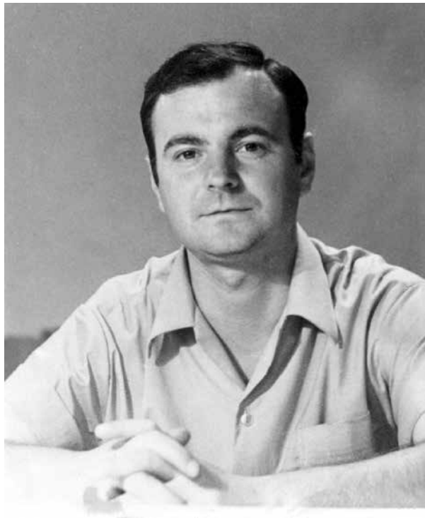
На заре педагогической юности

ня, улыбающегося, жизнерадостного, переполненного энергетикой. Внешне он не был красивцем, но обаянием, окутывавшим мгновенно, обладал незаурядным. Черты его лица притягивали искрящейся, тонкой добротой, которая пронизывала все — лоб, нос, щеки, даже руки. Глаза, быстрые, любопытные, любознательные, то сверкали, то замирали в задумчивости и каким-то удивительным образом гармонировали с голосом, переливавшимся множеством различных оттенков. А улыбка своей необычной, подкупающей простотой сразу брала в плен окружающих. Поэтому тогда, в далеком 1962-м, мы, крикливые, неуправляемые шестиклассники с неустойчивой психикой, очень разборчивые, влюбились в нового вожатого в течение часа. Хотя встретили его, рабочего агрегатного завода, студента-заочника политехнического института, с угрожающей настроенностью. В нем, как во всяком талантливом человеке, пряталась тайна. Впоследствии, спустя годы, мы ее разгадали: весь его внутренний мир, вся искрометная фантазия были скрыты в жесткой коже и устремлялись наружу как гейзер, когда общение перемещалось в детскую, подростковую среду. Здесь, в отличие от взрослой жизни, он, как правило, не совершал промахов. Рядовой слесарь, по отзывам некоторых коллег, иногда нудный, привередливый, ворчливый, преобра-