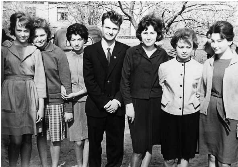
В него были влюблены все девушки нашего класса...