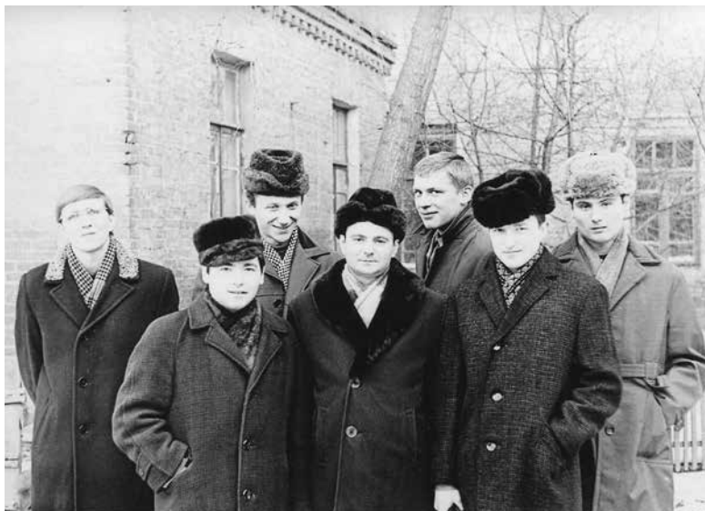
Первые воспитанники, когда-то переворачивавшие школу вверх дном, со временем остепенились...

ревьями, в подъездах, перепробовали весь местный ассортимент красных вин и табачных изделий, он решил применить в этом случае свой психологический расчет: не запрещать совсем эти выпивки, позволяющие, по нашему мнению, считать себя взрослыми мужиками, а заменить вино очень легкой, практически без градусов, домашней наливкой. Но и такой поступок вызвал нарекания со стороны домашних, объявивших ему бойкот, некоторых родителей, пытавшихся обвинить его чуть ли не в растлении малолетних. Тогда заканчивалось время хрущевской оттепели: пили многие, это явление постепенно проникало и в школьную среду. Но Валерий видел, что микробы алкоголизма еще не затронули его подопечных, никакой деформации личности не произошло, скорее, сработали ребяческая заносчивость и юношеский максимализм. Кроме того, он отметил парадоксальное явление: в классе в основном собрались дети с хорошей успеваемостью, неплохим интеллектом, из благополучных семей, имевшие не только прочную нравственную основу, но и весьма развитое честолюбие, сочетавшееся со здоровым тщеславием: всем хотелось многого добиться. Он, как охотник, почувствовал нужный для атаки момент и, не вызывая противодействия запретами, ненавязчиво повел разговоры о будущем, о карьере, незаметно переплетая их со школьными делами, с индивидуальными достоинствами каждого.