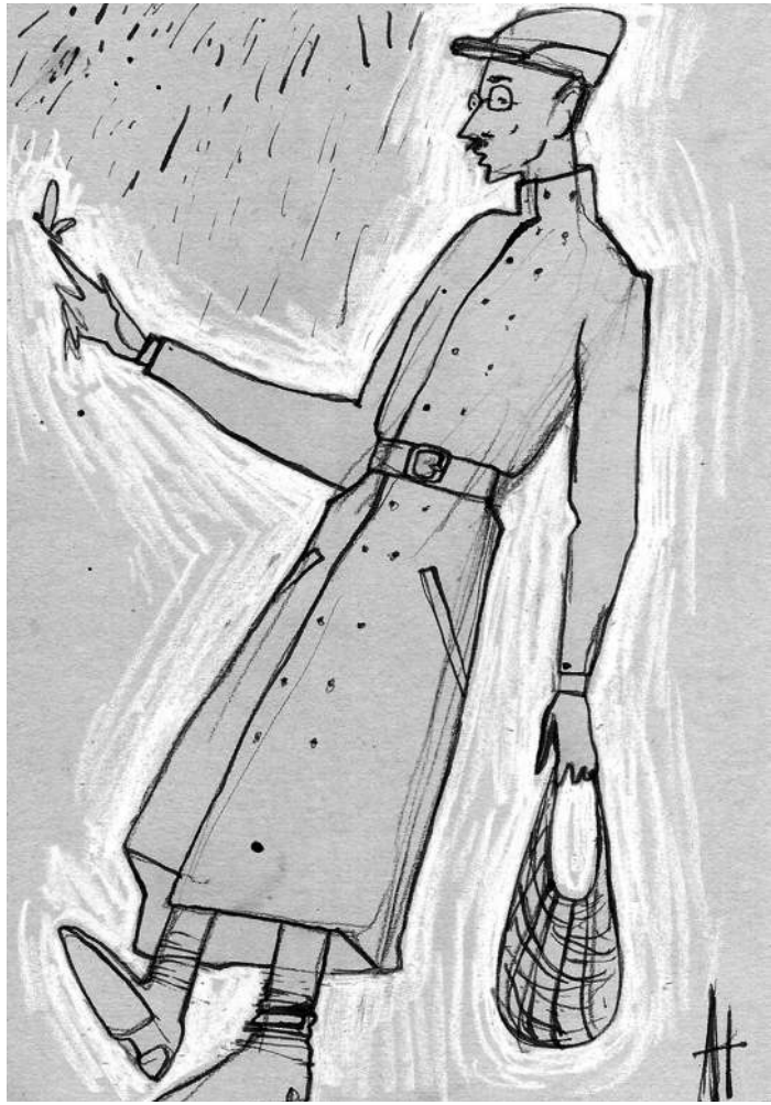
Настя Аверочкина. Дед