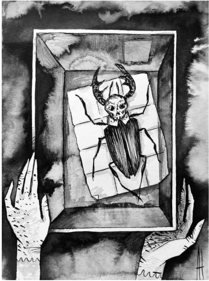
Настя Аверочкина. Грегор