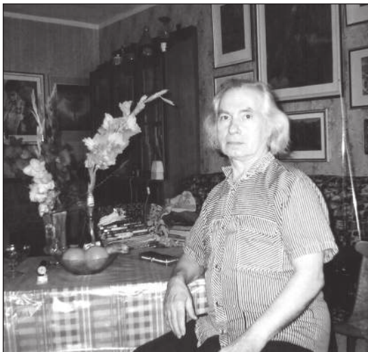
75 лет. Бобруйск, 2011

В.С. Спасибо, батюшка, за столь откровенную и поучительную беседу. Впрочем, других наших бесед я с вами и не припомню.