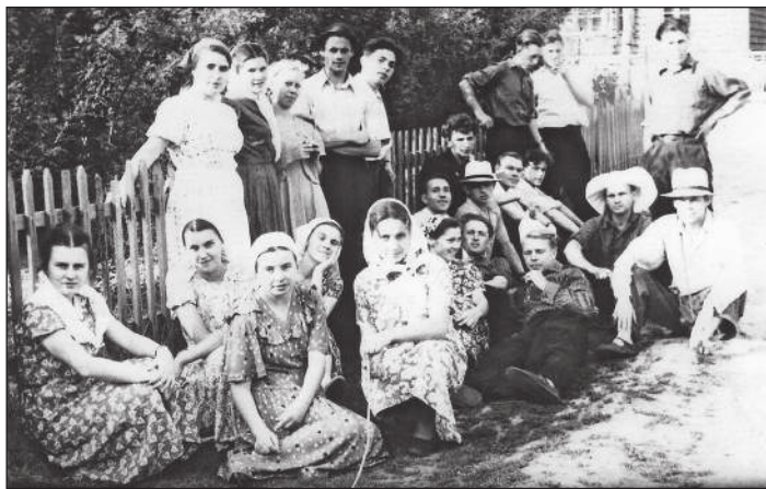
4 курс Горьковского художественного училища, 1956 год.