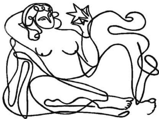
Графика Надежды Кашиной