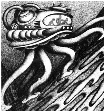
Графика Николая Недбайло

— После разгрома группы «13» за формализм её участников разбросало по стране. Как разгром сказался на Кашиных и Недбайло?